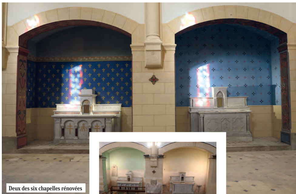
Deux des six chapelles rénovées