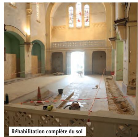
Réhabilitation complète du sol