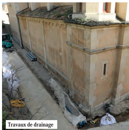
Travaux de drainage